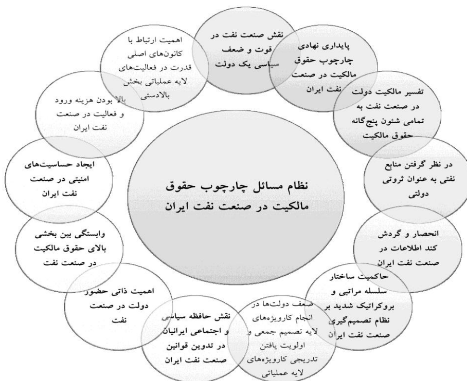
شکل شماره ۳: مسیرهای مؤثر بر شکل‌گیری چارچوب حقوق مالکیت صنعت نفت ایران

حال و بر اساس آنچه در خصوص برش‌های مفهومی فوق بیان گردید، مشخص است که الگوی موجود حقوق مالکیت صنعت نفت ایران در قالب ۱۳ مسیر مشخص، که تبیین‌کننده نظام مسائل حاکم بر حقوق مالکیت این صنعت هستند، ایجاد شده که در شکل شماره ۳ به آن اشاره شده است. همچنین، جدول شماره ۲ نیز، چگونگی نقش‌آفرینی تمامی این ارتباطات متقابل را در ایجاد الگوی کنونی حقوق مالکیت صنعت نفت ایران، به صورت یکجا نشان می‌دهد.