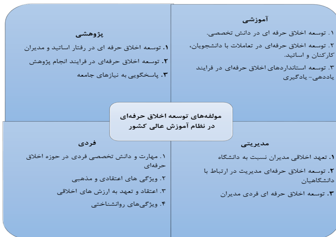
شکل ۳: مدل مفهومی مؤلفه‌های توسعه اخلاق حرفه‌ای در نظام آموزش عالی کشور

۶. گام ششم، حفظ کنترل کیفیت: شاید ارزیابی مطالعات برای دربرداشتن معیارهای کیفیت مهم‌تر از ارزیابی مطالعات برای دربرداشتن معیارهای شمول و مرتبط بودن، است. در روش فراترکیب و در این گام، رویه‌های زیر برای حفظ کیفیت مطالعه انتخابی در نظر گرفته شده‌اند: در فرایند پژوهش محقق تلاش می‌کند تا با فراهم آوردن توضیحات و توصیف روشن و واضح برای گزینه‌های موجود در پژوهش گام‌های اتخاذ شده را بردارد. پژوهشگران روش‌های کنترل کیفیت استفاده شده در مطالعه‌های تحقیق کیفی اصلی را به کار می‌برند، محققان با به کارگیری راهکار جستجوی الکترونیکی و دستی، مقالات مرتبط را پیدا می‌کنند. در زمان مناسب، محقق رویکردها و نگرش‌های مستقر را جهت تلفیق مطالعات اصلی در پژوهش کیفی استفاده می‌کند. در زمان مناسب، محقق از برنامه‌های مستقر و محرز مانند ابزار حیاتی جهت ارزیابی کیفیت مطالعات اصلی پژوهش کیفی استفاده می‌کند. در این پژوهش از ابزار حیاتی جهت ارزیابی فرایند فراترکیب