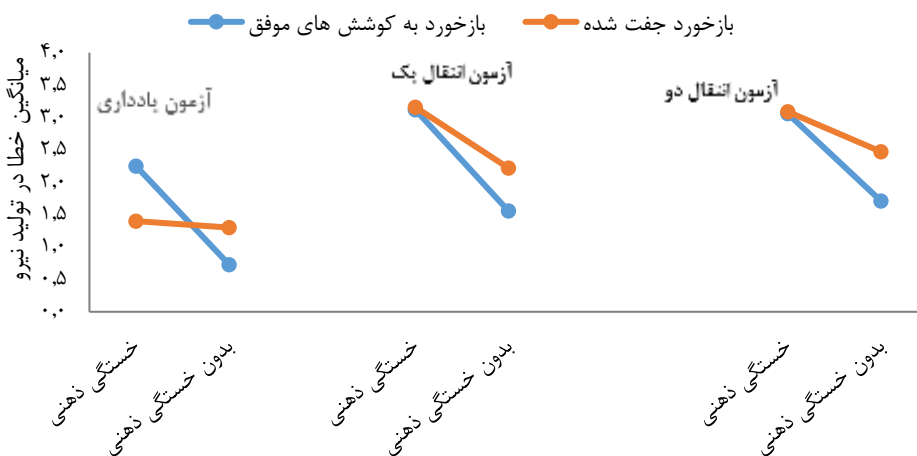
شکل ۲- میانگین خطای تولید نیرو در گروه‌های بازخورد به کوشش‌های موفق و جفت‌شده در شرایط با و بدون خستگی ذهنی در آزمون‌های یادداری، انتقال یک و انتقال دو

نتایج آزمون تحلیل واریانس دوطرفه در آزمون‌های یادداری، انتقال یک و انتقال دو (جدول شماره چهار) نشان می‌دهد که اثر اصلی خستگی ذهنی معنادار است. نتایج مقایسه‌های دوگانه نشان داد که در هر سه آزمون، گروه‌هایی که در شرایط خستگی ذهنی تمرین کرده بودند، خطای بیشتر و یادگیری کمتری داشتند؛ اما اثر اصلی بازخورد و اثر تعاملی بازخورد با خستگی ذهنی در آزمون‌های یادداری، انتقال یک و انتقال دو (به‌جز اثر تعاملی در آزمون یادداری) معنادار نیست.