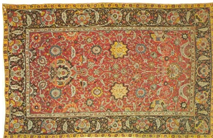
تصویر ۵. قالی افشان شاه‌عباسی گلابتون‌دار با حاشیه‌ی هراتی، اواسط قرن ۱۶ م/۱۰ ق. موزه‌ی فرش آستان قدس رضوی.

فرش آستان قدس رضوی دارد. (تصویر ۵) آرتر آپم پوپ با مطالعه‌ی دقیق فرش‌های ایرانی بیان می‌دارد که طرح‌های افشان شاه‌عباسی در سده‌های ۱۰ و ۱۱ ق/۱۶ و ۱۷، بر سایر طرح‌ها برتری داشته و نگاره‌های مهم آن عبارت‌اند از گل‌های شاه‌عباسی بزرگی که شکل کلی آن یادآور درخت کیهانی است. رنگ زمینه اغلب این فرش‌ها لاک‌سیر است که گاهی به طیف‌های شرابی‌رنگ، سرخ و یاقوتی تغییر می‌یابد و گه‌گاه صورتی‌فام می‌شود، با حاشیه‌ای پهن که در برخی از نمونه‌ها رنگ سبز زمردی سیر و در نمونه‌های دیگر به رنگ سبز متمایل به آبی یا همان آبی هستند. ۱