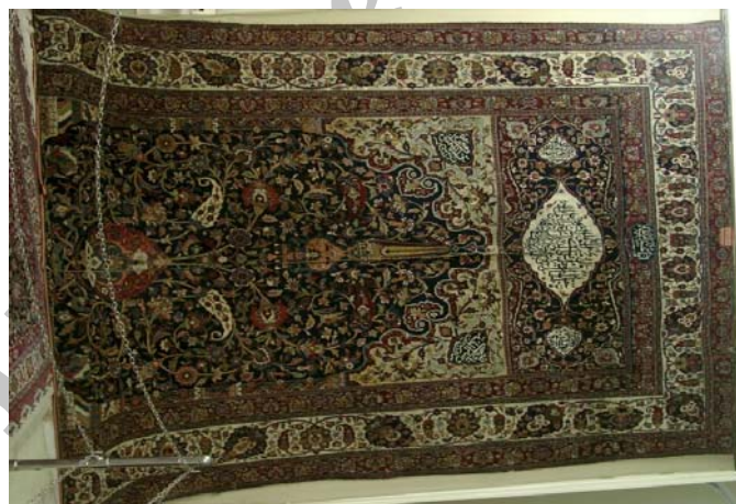
تصویر ۱. نمای کلی قالی پرده‌ای دو رو با نقش محرابی - افشان شاه‌عباسی قنديل‌دار.

قالی «محرابی - افشان شاه‌عباسی قنديل‌دار» به شماره شناسایی ۰۴۱ ردیف ۴۰ و شماره اموالی ۳۴۷ در معرض دید عموم مردم قرار دارد. (تصویر ۱) این دستباف با توجه به کتیبه‌های موجود در ۱۳۲۲ ق. / ۱۹۰۴ م. در شهر مشهد و با همکاری تولیدکنندگان تبریزی، مشهدی و کرمانی در ابعاد ۳۲۱ × ۴۱۰ سانتیمتر بافته شده است. جنس تار و پود آن پنبه و پرزاز پشم است. در هر ۶/۵ سانتیمتر ۴۰ گره نامتقارن (فارسی) زده شده، طول ساق‌های گره بین ۳/۵ الی ۵ میلی‌متر است. فرش به شیوه تمام لول بافته شده است و پس از هر رج بافت پود ضخیم و نازک را عبور داده‌اند، شیرازه نیز در وسط و طرفین قالی به صورت متصل بافته شده است. رنگ‌های آن شیمیایی و گیاهی هستند عمده رنگ‌های قالی عبارت‌اند از: لاک‌ی قرمز دانه، سورمه‌ای، آبی، نارنجی، کرم، سبز روشن، آبی تیره، قهوه‌ای روشن، سبز زیتونی، سبزآبی روشن، آبی روشن، بنفش روشن، خاکستری، روناسی و... قسمت‌هایی از فرش دچار صدماتی از قبیل بیدزدگی، ساییدگی، پارگی و دورنگی است که نیاز به مرمت مجدد دارد.