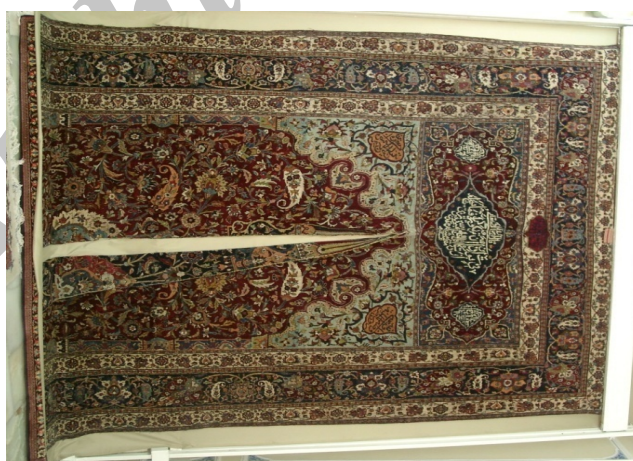
تصویر ۸. پشت قالی دو رو با نقش محرابی - افشان شاه‌عباسی قندیل‌دار - با رنگ بندی متفاوت بافته شده است.