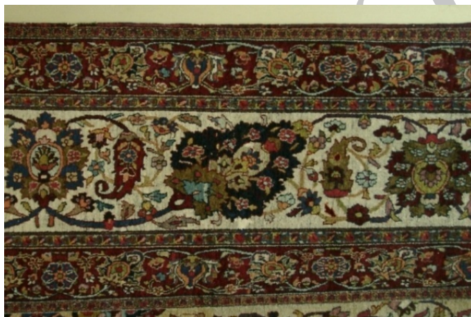
تصویر ۲. حاشیه اصلی و دو حاشیه فرعی با طرح هراتی تزیین شده است. (مأخذ تصویر: نگارنده).

الف) حاشیه: حاشیه‌ی فرش، دارای هشت نوار تزیینی است. (تصویر ۲) لور یا ساده‌بافی بدون طرح و به رنگ قرمز لاک‌پشته شده است. زنجیره اول به رنگ نارنجی و با عناصر کوچک ختایی تزیین شده است. لازم به ذکر است که فقط همین دو قسمت (زنجیره و ساده‌بافی) دورتادور فرش بافته شده‌اند و سایر نوارهای تزیینی تنها در سه سمت (بالا و سمت چپ و راست قالی) به حرکت درآمده‌اند. حاشیه‌ی فرعی اول و دوم به رنگ لاک‌پشته و با گل و برگ ختایی تزیین شده است. زنجیره‌های دوم و سوم به رنگ آبی تیره و به شیوه‌ی واگیره محو کار شده است.