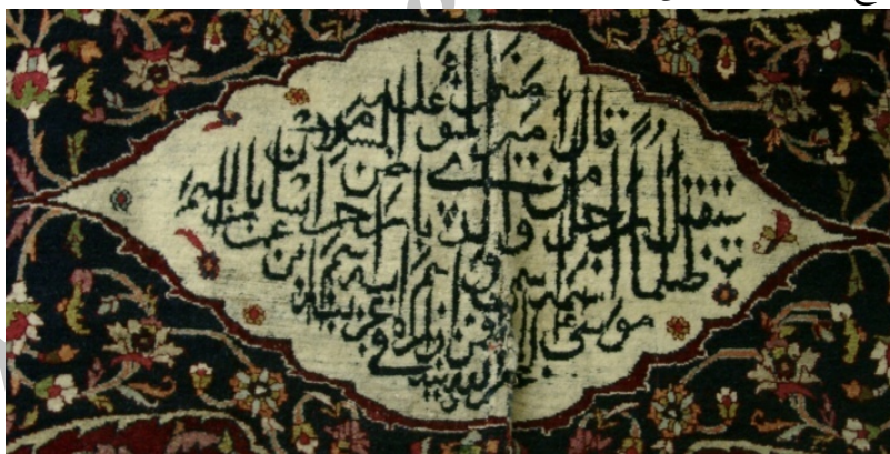
تصویر ۳. کتیبه داخل ترنج پیشانی قالی پرده‌ای دو رو.

۱. پیشانی: این قسمت با حرکت زنجیره چهارم به داخل متن فرش از طاق محراب جدا شده و طراح در فضای مستطیل ایجاد شده طرح لچک و ترنج را اجرا کرده است. لچک‌های این قالیچه به رنگ لاک‌ی و مزین به عناصر ختایی هستند. متن قالیچه سورمه‌ای و با گردش شاخه ختایی تزیین شده است. ترنج آن به رنگ کرم و لوزی شکل است و در آن حدیثی به رنگ تیره و به قلم ثلث آمده است: (تصویر ۳) قال امیرالمؤمنین علیه السلام سیقتل رجل من ولدی بارض خراسان بالسم ظلماً اسمه اسمی و اسم ابیه اسم ابن عمران موسی (ع) الا فمن زاره فی غربه غفر الله ذنبه ۱