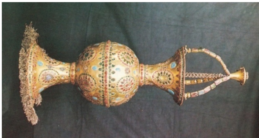
تصویر ۷. قندیل طلای مرصع، قرن ۱۳ ق/ ۱۹ موزه آستان قدس رضوی.

در انتها لازم به ذکر است که بافندگان، همین طرح را اما با رنگ بندی متفاوت در پشت قالی اجرا کرده‌اند. به طوری که حاشیه اصلی و ترنج کتیبه‌دار به رنگ سورمه‌ای، متن قالی و متن قالیچه پیشانی به رنگ قرمز لاکه و حاشیه‌های فرعی به رنگ کرم بافته شده‌اند. (تصویر