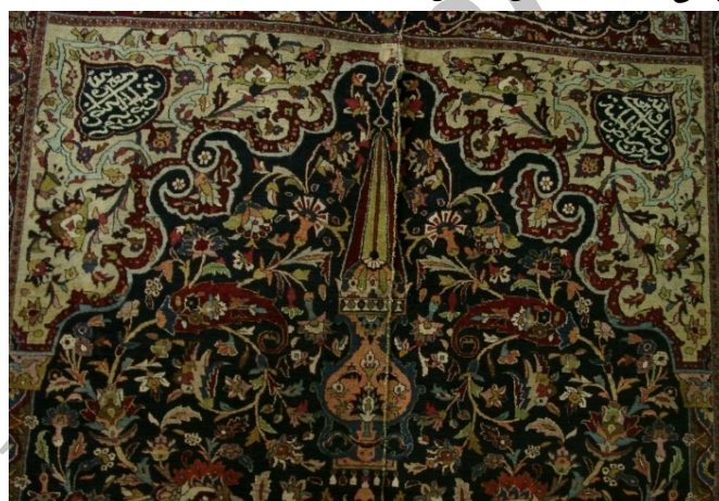
تصویر ۴. طاق محراب همراه با کتیبه‌ها و قندیل.

ج) متن قالی: متن قالی به رنگ سورمه‌ای بافته شده است. طراح با ایجاد دونیم ستون و قرار دادن طاق محراب بر روی آن فضای همچون مدخل ورودی باغ ایرانی یا محراب مساجد ایجاد کرده است. متن اصلی با طرح افشان شاه‌عباسی تزئین شده است. طراح بند ختایی را از دو سمت گل شاه‌عباسی بزرگی که در قسمت پایین قرار گرفته، خارج کرده و در تمامی متن قالی به حرکت درآورده است. این قسمت، همچون حاشیه‌ی اصلی شباهت فراوانی به آثار شاخص عصر صفوی به ویژه فرش افشان شاه‌عباسی گلابتون‌دار موزه‌ی