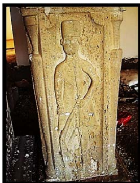
تصویر ۲۱. سربازان نگهبان قلعه شلمزار، چهارمحال و بختیاری