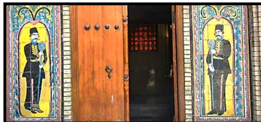
تصویر ۱۹. سربازان نگهبان عمارت بادگیر کاخ گلستان.