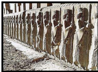
تصویر ۱۷. سربازان نگهبان تخت جمشید.

حضور سرباز نگهبان در قسمت ورودی به عنوان پاسدار دروازه، سنتی دیرینه و باستانی است که نمونه شاخص آن سربازان حجاری شده در تخت جمشید است (تصویر ۱۷).