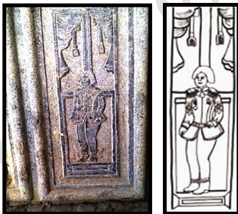
تصویر ۱۴. جوان با یونیفرم فرنگی، ورودی قلعه چالستر

این نقش نیز در قسمت ازاره‌های ورودی بنا حجاری شده و چنان که مشاهده می‌شود این مرد ایستاده در فضایی با پرده‌های تزئینی، ملبس به لباس نظامی اروپایی است و مدل موی فرنگی دارد (تصویر ۱۴).