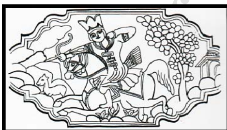
تصویر ۴. عکس و ترسیمی از نگاره شکارشاه (راست: تاج کیانی قاجاری. چپ: تاج قزلباش صفوی) هشتی قلعه چالشر. (نگارنده)