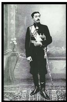
تصویر ۱۵. شاهزاده قاجار با تیپ و یونیفرم اروپایی.