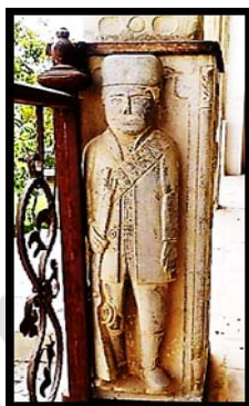
تصویر ۲۰. سربازان نگهبان ورودی قلعه شمس‌آباد.

بناهای مذکور تقریباً همزمان با قلعه چالستر ساخته شده‌اند، و می‌توان گفت همه ویژگی‌هایی که در سربازان نگهبان قلعه چالستر وجود دارد در دو قلعه اخیر نیز دیده می‌شود.