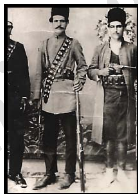
تصویر ۱۶. سربازان دوره قاجار.

البسه عصر قاجار در عکس‌های بازمانده از این دوره نمایانده شده (تصویر ۱۶)، و می‌توان مشابهت بین آنها و لباس‌های نگهبانان و شخصیت‌های محلی مندرج در تزئینات این بنا را ملاحظه کرد.