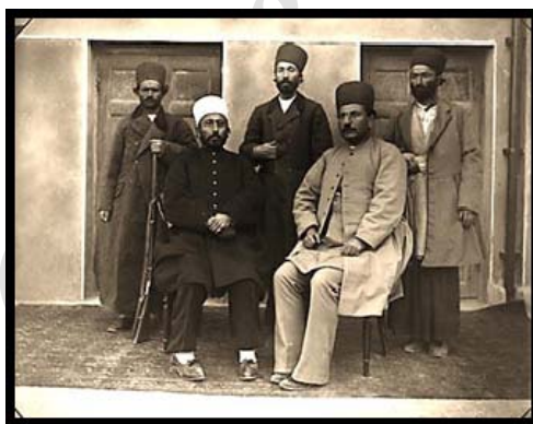
تصویر ۲. پوشش رایج مردان، عکس مربوط به دوره قاجار

جبه‌شان را از جنس ماهوت می‌دوختند و سایر طبقات که استطاعت خرید ماهوت را نداشتند از پارچه‌های دستباف ایرانی استفاده می‌کردند. این روپوش با ورود فرهنگ اروپایی در قالب مدل «پقه انگلیسی» دوخته می‌شد و ردیف دکمه‌ها نیز برای بستن لباس استفاده می‌شد. همه مردان بعد از پوشیدن جبه شالی به کمر می‌بستند که برایشان حکم جیب داشت. در زیر جبه یا قبا «جلیقه کوتاه» یا «ارخالیق» پوشیده می‌شد و زیر جلیقه «زیرپوش» بر تن می‌کردند. با فرارسیدن فصل زمستان نیز از پوششی به نام «کلیجه» استفاده می‌کردند که مانند مانتویی بلند و جلو باز بود و زنان و مردان به یکسان از آن استفاده می‌کردند. این بالاپوش احتمالاً قبای آستین‌بلندی بوده که روی قبای اصلی پوشیده می‌شده است. در کنار پوشاک فوق، شلوار پاچه‌گشاد نیز پوشیده می‌شد. در خصوص پوشش پای مردان قابل ذکر است که «پاتابه»، «چکمه» و «گیوه» مورد استفاده قرار می‌گرفت.