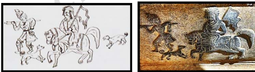
تصویر ۱۲. سوارکار بیرق‌به‌دست با شخصیت مذهبی در ورودی قلعه چالستر. (نگارنده)

نکته حائز اهمیت در این بخش از تزئینات قلعه چالستر آن است که الگوی مذهبی قاجاری با الگوی ملی، که همانا سوژه‌ی شاطر و سگ شکاری بود، ترکیب شده و از جنبه مذهبی