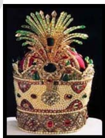
تصویر ۳. نمونه‌ای از تاج کیانی ۲

این بخش از نقوش مربوط به شخصیت‌های داستانی و اسطوره‌ای کهن ایرانی است که با لباس، تاج و آرایش کاملاً ایرانی ترسیم شده‌اند و اغلب موضوع داستان مربوط به شکار شاه و همچنین داستان اسطوره‌ای بهرام گور و آزاده (فتنه) و شکارچی قوش به دست است، که مضمونی کاملاً ملی و باستانی دارد و لذا اشخاص پوششی ملی بر تن دارند. این دسته از نقوش حجاری شده شامل شخصیت شاه در داستان شکارهای بهرام گور و یا در حالت سوارکاری و با تاج بر سرش مشخص است. انواع تاج به‌کاررفته بر سر شاه شامل «تاج کیانی قاجاری» و «تاج قزلباش» ۲ و همچنین جامه بر تنش پیراهنی مجلل، کوتاه و چین‌دار با ردیف دکمه‌های متقابل است. بنا بر مقتضیات شکار نیز چکمه پوشیده است (تصویر ۴).