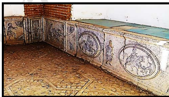
تصویر ۲۳. تصویری کلی از حالات و جهت حرکت سوارکاران به سمت دروازه، ورودی قلعه چالستر. (نگارنده)

نکته مهم دیگر در تزئینات سنگی با نقش انسانی این است که جهت حرکت و صورت شخصیت‌های مندرج بر ازاره‌ها در دو طرف دروازه به سمت در ورودی است (تصویر ۲۳)، و این موضوع در قسمت هشتی نیز تکرار می‌شود، ولی جهت حرکت شخصیت‌ها (و حتی شکار) رو به در منتهی به داخل عمارت است. این مسائل اشاره بر بومی بودن نقوش و انطباقشان با فرهنگ و عقاید ساکنین قلعه دارد، به گونه‌ای که هر بخش از مدخل و ورودی بنا جایگاه و کارکردی ویژه داشته است.