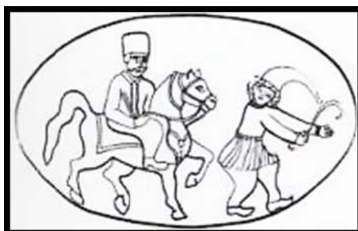
تصویر ۷. شاطر و سوارکار، ورودی عمارت قلعه چالستر. (نگارنده)