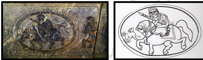
تصویر ۱۱. سوارکار نیزه‌به‌دست با پوشش مذهبی، شخصیت مذهبی در ورودی قلعه چالستر.