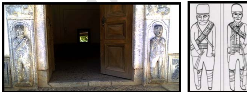
تصویر ۲۲. نگهبانان محلی، ورودی قلعه چالستر.

دیگر خصیصه مهم تصویرگری در این بنا در خصوص اهمیت «کلاه خسروی» در میان قوم بختیاری است. در بین این قوم مرسوم چنان بوده که افراد بنا بر حالات روانی مختلف کلاه را به عقب و جلو می‌کشانده‌اند و حالات شخصیتی متفاوت از این طریق بروز داده می‌شده است. از این رو در حجاری هر سه بنای استان چهارمحال و بختیاری کلاه‌ها موازی خط افق و حتی تا خط ابرو که به نوعی ایجاد اخم می‌نماید جلو است (تصویر ۲۲). ولی در حجاری‌های نارنجستان خط کلاه با هلال پیشانی هم‌تراز شده است.