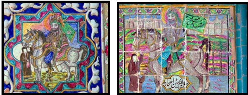
تصاویر ۹ و ۱۰. شخصیت‌های مذهبی در تکیه معاون‌الملک کرمانشاه. (نگارنده)

کاشی‌کاری‌های متنوع با این نوع مضامین را در خود جای داده و سند مناسبی برای جستجوی مؤلفه‌های مذهبی در تزئینات معماری قاجاری است (تصاویر ۹، ۱۰ و ۱۲).