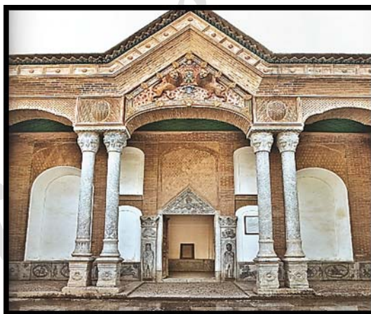
تصویر ۱. ورودی اصلی قلعه چالشر (نگارنده)

با توجه به چنین موقعیت و قدرتی، الگوبرداری از تزئینات کاخ‌ها و عمارات شاهان قاجار برای آراستن این بنا امری بدیهی است، چنان که در زمینه استفاده از نقوش انسانی در قسمت ورودی، هشتی و اطراف حوض خانه احمدخان، انواع سه‌گانه تزئینات متداول در عصر قاجار یعنی نقوش با مضامین ملی، فرهنگی و مذهبی به کار گرفته شده است. از طرفی با توجه به موقعیت و قدرت خوانین منطقه چهارمحال، عناصری محلی در ترکیب با این تزئینات سنگی لحاظ شده است. مؤلفه‌هایی چون پوشش و البسه، و عناصر زینتی، (الگوهای پوششی) تفکیک و شناخت هویت هر یک از گروه‌های انسانی را مقدور ساخته است (تصویر ۱).