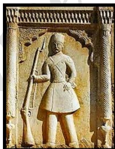
تصویر ۱۸. سرباز مسلح ورودی باغ نارنجستان قوام شیراز.

این سنت در سایر بناها و کاخ‌های شاهان عصر قاجار نظیر سردر ورودی عمارت بادگیر «کاخ گلستان» نیز دیده می‌شود (تصویر ۱۹). همچنین نمونه دیگری از سربازان نگهبان در بنای «نارنجستان قوام» دیده می‌شود که با لباس و کلاهی مشابه لباس ارتشی قاجار حجاری شده‌اند (تصویر ۱۸).