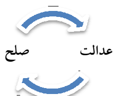
نمودار شماره ۲. صلح عادلانه