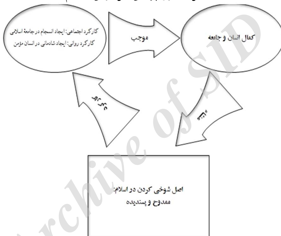
شکل ۱. الگوی چرخشی اصل شوخی در اسلام

طبق این الگو، شوخی کردن امری ممدوح و پسندیده است، این مدح از دو جهت قابل توجیه است: