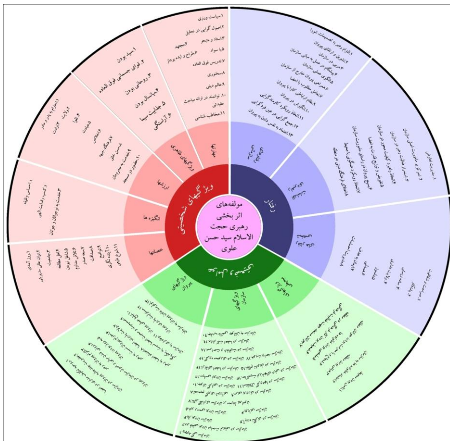
شکل ۱. مدل مفهومی رهبری در مسجد صفا