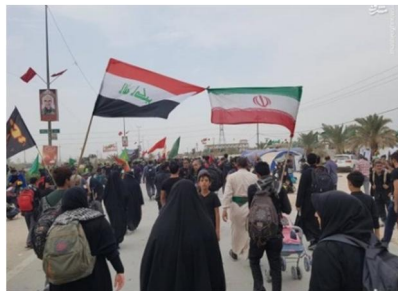
تصویر ۳: پرچم ها و نمادها ۱۶

نقاشی امام حسین (ع)، حضرت عباس (ع)، بدن تیرخورده و پاره پاره و خونین، مشک پاره، حضرت علی اصغر (ع) و اسراء در مسیر دیده می شود. زائران نیز نمادهایی با خود دارند از جمله سربندهایی که حاوی شعارهای حماسی یا توسل به ائمه (ع) می باشد؛ پرچم هایی با شعارهای یا حسین و یا مهدی و ... و یا پرچم کشورهایشان، و کوله نوشته هایی که آن ها نیز دارای مضامین مذهبی و حماسی هستند. برخی از زائران نیز عکس شهیدی را با خود حمل می کنند و نیت کرده اند که به نیابت از آن شهید پیاده به کربلا بروند.