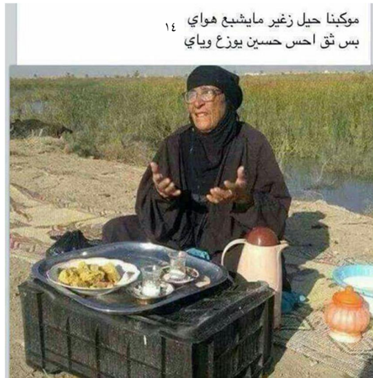
موکبنا حیل زغیر مایشیع هوای بس ثق احس حسین یوزع ویای ۱۴

موکب‌ها گاه خیلی کوچک و خاص هستند، مثل پیرزنی که با یک فلاکس کنار جاده نشسته و چای توزیع می‌کند و یا کودکی که با یک پارچ و لیوان آب توزیع می‌کند.