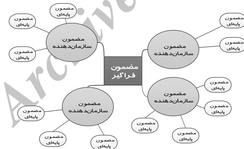
نمودار ۱: ساختار یک شبکه مضمونی (Attride-Stirling, 2001: 388)

مشخص، پایین‌ترین سطح قضایای پدیده را از متن بیرون می‌کشد (مضامین پایه)؛ سپس با دسته‌بندی این مضامین پایه‌ای و تلخیص آنها به اصول مجردتر و انتزاعی‌تر دست پیدا می‌کند (مضامین سازمان‌دهنده)؛ در قدم سوم این مضامین عالی در قالب استعاره‌های (Stirling-Attride, 2001: 388) اساسی گنجانده شده و به صورت مضامین حاکم بر کل متن در می‌آیند (مضامین فراگیر) (Stirling-Attride, 2001: 388)؛ سپس این مضامین به صورت نقشه‌های شبکه تارنما، رسم و مضامین برجسته‌ی هر یک از این سه سطح همراه با روابط میان آنها نشان داده می‌شود. بر خلاف روش قالب مضامین، شبکه‌های مضامین به صورت گرافیکی و شبیه تارنما نشان داده می‌شوند تا تصور وجود هر گونه سلسله مراتب در میان آنها از بین برود، باعث شناوری مضامین شود و بر وابستگی و ارتباط متقابل میان شبکه تاکید شود. در این نوع تحلیل، سعی بر این است که از مضامین پایه‌ای که آشکار و مصرح هستند به سوی مضامین انتزاعی‌تر و کلی‌تر حرکت شود تا به مضمون (یا مضامین) اصلی متن دست پیدا کنیم. (Attride-Stirling, 2001: 3)