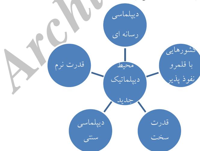
نمودار شماره (۲) محیط بین‌المللی جدید

این محیط جدید که به وضوح ظاهر شده محصول سه عرصه وسیع و وابسته و در حال انقلاب و دگرگونی مداوم یعنی اطلاعات، سیاست و اقتصاد است. آنچنانکه در نمودار شماره (۲) آمده است این محیط ساختاری است مرکب از: «کشورهایی با قلمروئی نفوذپذیر»، «قدرت سخت + قدرت نرم»، «دیپلماسی سنتی + دیپلماسی رسانه‌ای» (کیمیایی؛ خرازی آذر، سلطانی فر، ۱۳۹۴: ۶۰-۵۸).