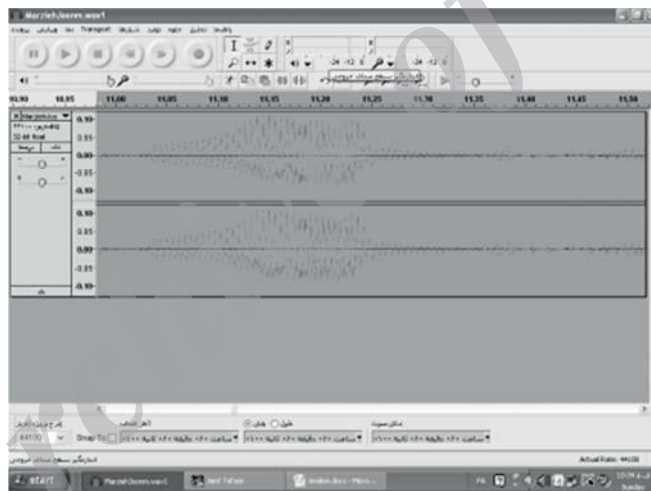
شکل موج آیه ابتدایی داستان دو مرد باغ‌دار / زوم به داخل / روان خوانی «وَاضْرِبْ لَهُمْ مَثَلًا رَجُلَيْنِ جَعَلْنَا لِأَحَدِهِمَا جَنَّتَيْنِ مِنْ أَعْنَابٍ وَحَفَفْنَاهُمَا بَسْمَلٍ وَجَعَلْنَا بَيْنَهُمَا زَرْعًا» (کهف / ۳۲)