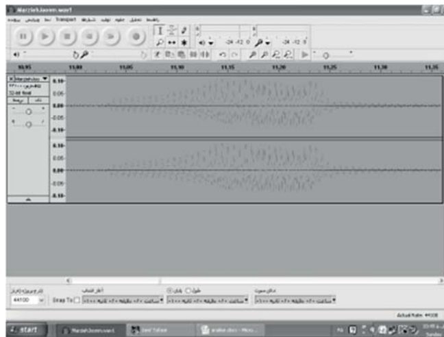
شکل موج آیه ابتدایی داستان خضر و موسی / زوم به داخل / روان خوانی

«وَإِذْ قَالَ مُوسَىٰ لِفَتَاهُ لَا أَبْرَحُ حَتَّىٰ أَبْلُغَ مَجْمَعَ الْبَحْرَيْنِ أَوْ أَمْضِيَ حُقُبًا» (کهف / ۶۰)