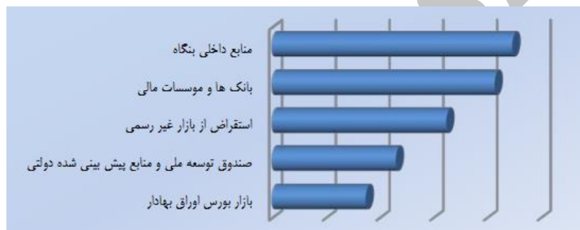
نمودار شماره (۲). مهم‌ترین روش‌های تأمین مالی بنگاه‌های اقتصادی کشور

نتایج حاصل از گزارش رقابت‌پذیری مجمع جهانی اقتصاد نشان می‌دهد که از نگاه فعالان اقتصادی در ایران، مشکل دسترسی به منابع مالی در میان ۱۵ مانع موجود بر سر راه کسب‌وکار در ایران، بالاترین رتبه را به خود اختصاص داده و مهم‌تر از سایر موانع، نظیر عدم ثبات در سیاست‌های دولت و تورم ارزیابی شده است. با توجه به این موضوع و با عنایت به اهمیت منابع مالی برای استمرار و افزایش رشد بنگاه‌ها، منابع مالی داخلی بنگاه‌ها می‌تواند به‌عنوان گزینه‌ای مناسب برای بنگاه‌ها مطرح باشد. نمودار شماره (۲) که حاصل نظرسنجی از فعالان اقتصادی کشور است، به‌وضوح اهمیت و جایگاه تأمین منابع مالی داخلی در شرایط فعلی کشور را نمایش می‌دهد.