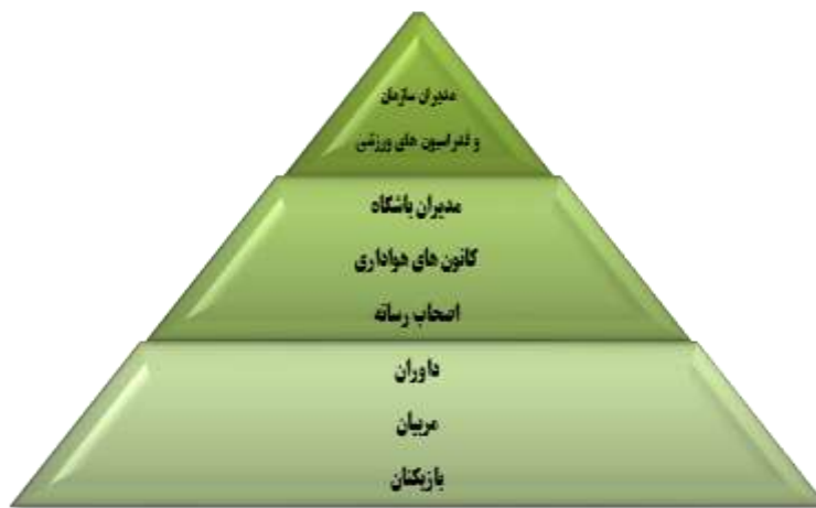
شکل ۳- هرم پیشنهادی برگرفته از مدل مفهومی و یافته‌های پژوهش

مفهومی انجام شود که در سطح خرد، بازیکنان، مربیان و داوران می‌توانند جامعه هدف آموزش درزمینه آشنایی با قوانین و شناساندن خطوط قرمز باشند. در سطوح میانی نیز مدیران باشگاه‌ها، کانون‌های هواداری و کارکنان می‌توانند جامعه هدف آموزش قرار گیرند و در سطح کلان نیز مدیران سازمان‌های ورزشی و فدراسیون می‌توانند جامعه هدف آموزش قرار گیرند که در هرم آموزش کاهش فساد در شکل مشاره سه مشاهده می‌شود: