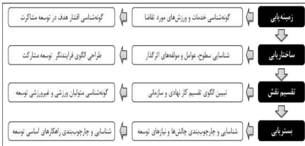
شکل ۱- چهارچوب تحلیل مفهومی پژوهش

چهارچوب تحلیل مفهومی و محتوای پژوهش، در قالب سه رویکرد اصلی زمینه‌یابی، ساختاریابی و چهارچوب‌بندی عامل‌ها، شاخص‌ها و رویکردهای توسعه‌ی مشارکت ورزشی، به‌صورت شکل شماره ۱ یک ترسیم شده است. این چهارچوب، حاصل نظام‌مندسازی محتوا و فرایند این پژوهش براساس اصول پژوهش در مدیریت ورزشی است.