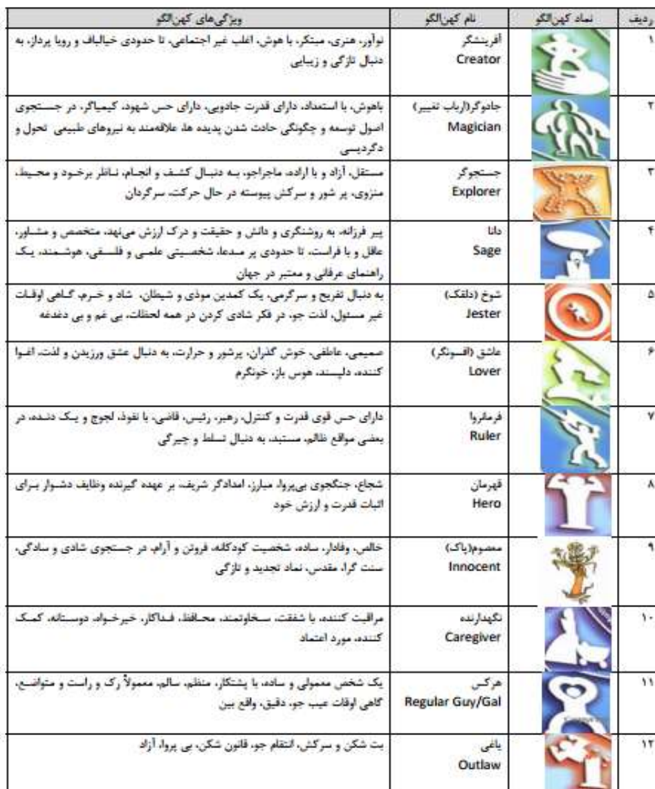
شکل ۱-۱۲ کهن‌الگوی کمپل