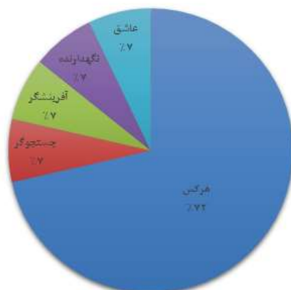
شکل ۲- کهن‌الگوی کنونی سازمان لیگ