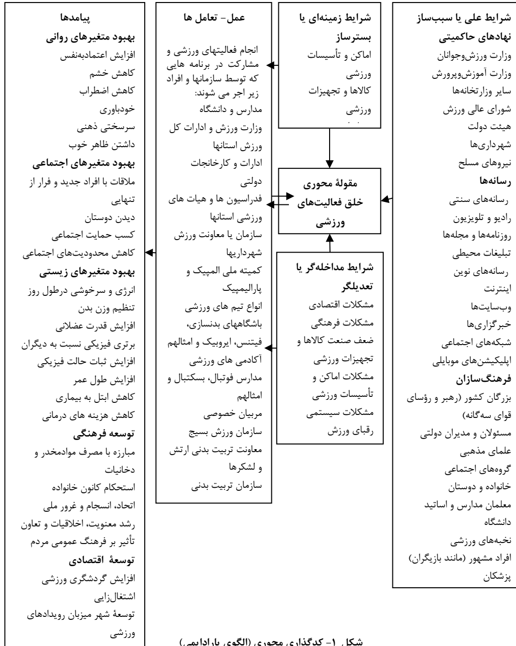
شکل ۱- کدگذاری محوری (الگوی پارادایمی)