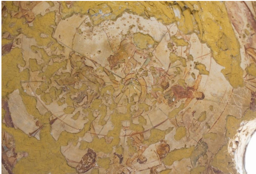
تصویر ۱. نمادهایی از صورت‌های فلکی نقاشی شده بر سقف گنبد در حمام قصیر عمره، ردن، سده دوم ه.ق

نقاشی‌های آن می‌پردازد و می‌گوید: «نقش بروج فلکی بر طاق اتاق گنبدپوش قصیر عمره و نقش چند انسان در تالار اصلی یک‌راست از هنر کلاسیک روم آمده است» (گرابار، ۱۳۹۶: ۲۱۲) و خاستگاه برخی نقاشی‌ها را ایران می‌داند.