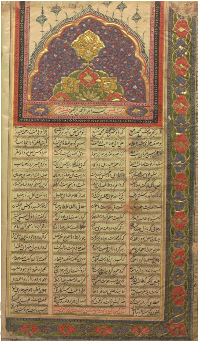
صفحه اول نسخه کتابخانه ملی با علامت مل (ایبات این صفحه همان «سرآغاز نجف» است)