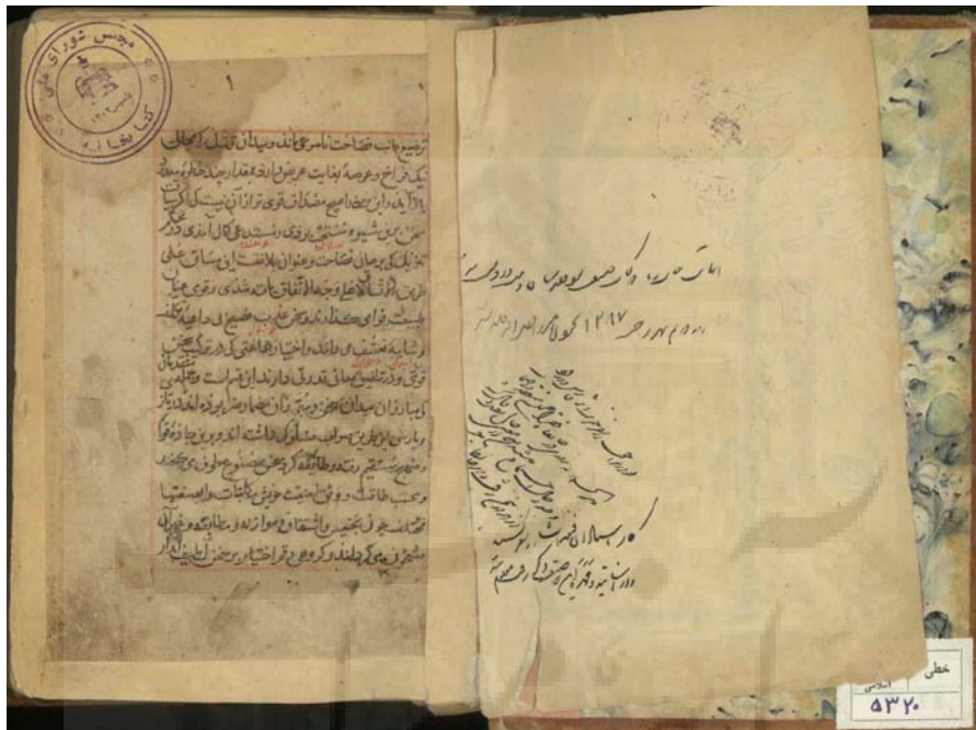
تصویر صفحه نخست نسخه ۵۳۲۰ کتابخانه مجلس