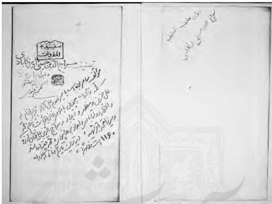
یادداشت مرحوم مجتبی مینوی در آغاز نسخه