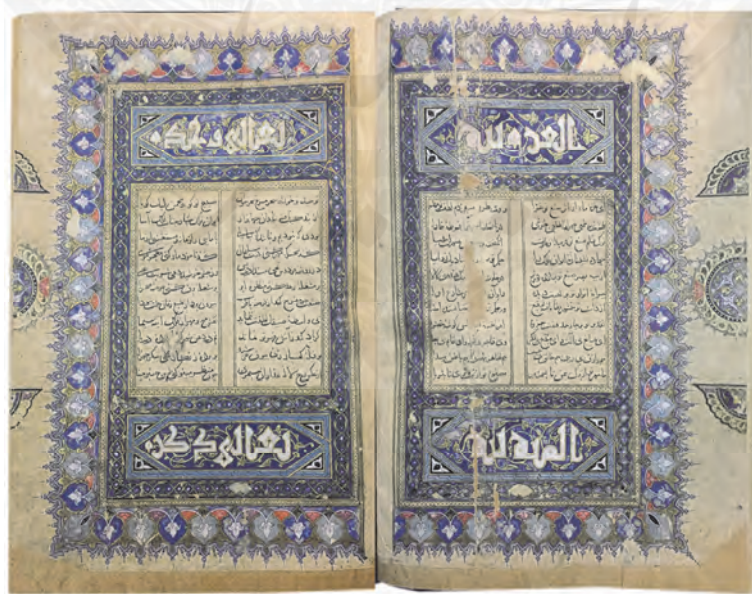
ب: دیوان خواجو، گ ۳ پ و ۴، نسخه Or. 11519 کتابخانه بریتانیا، لندن