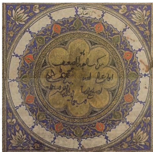
شاهنامه استیونز، گ ۷۰، LTS1998.1.1، گالری سکلر، واشنگتن