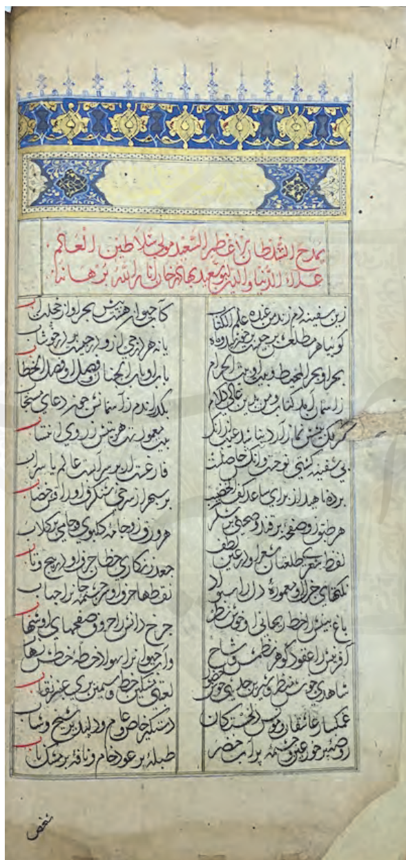
دیوان خواجه، گ ۲۱، Or. 8201، کتابخانه بریتانیا، لندن