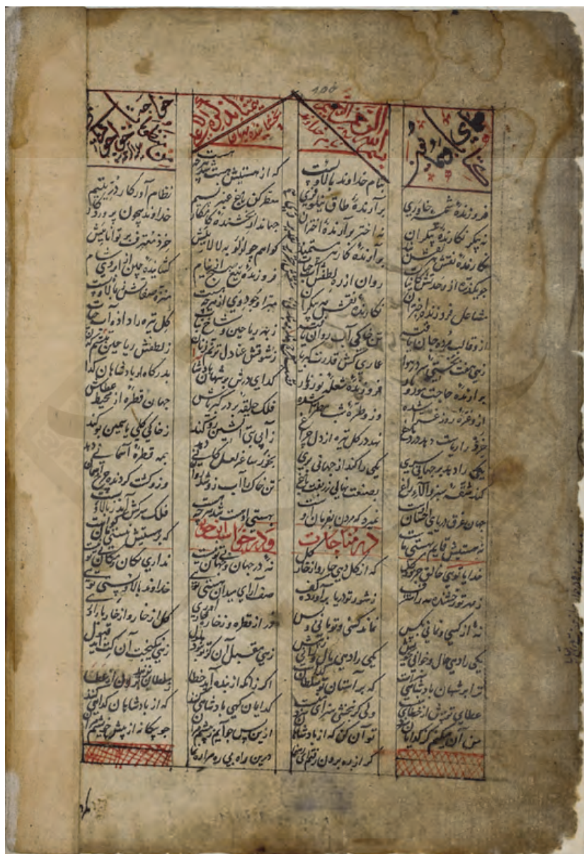
مثنوی همای و همایون، Cod. Mc. Pers. 47، کتابخانه دانشگاه گوتینگن