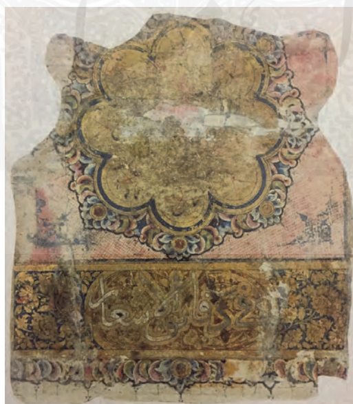
ب: مونس الاحرار فی دقائق الاشعار، گ ار، MS LNS 9، دارالآثار الاسلامیة، مجموعة الصباح، کویت