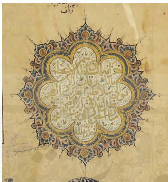
الف: معیار جمالی و مفتاح ابواسحاق، گ ار، شماره ۲۷۶۸، کتابخانه سرز، سلیمانیه، استانبول