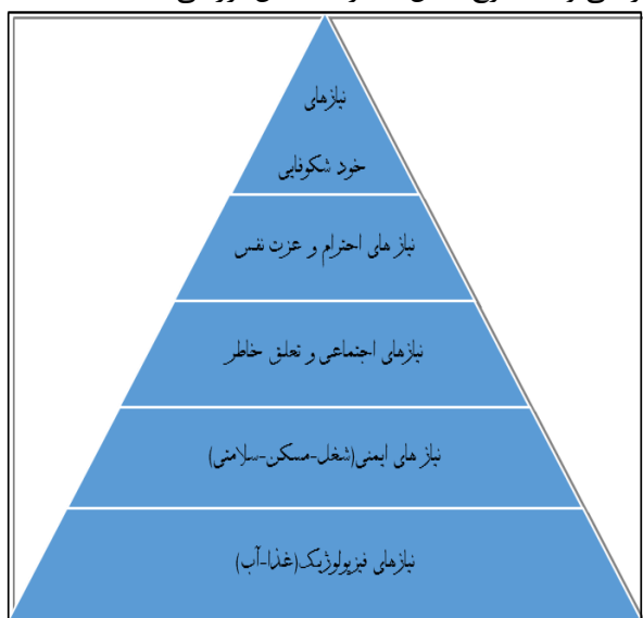
شکل ۲- هرم نیازهای سلسله‌مراتبی

بر اساس مدل مزلو، نیازهای انسانی به صورت سلسله-مراتبی و به شرح شکل شماره ۲، قابل بررسی است: