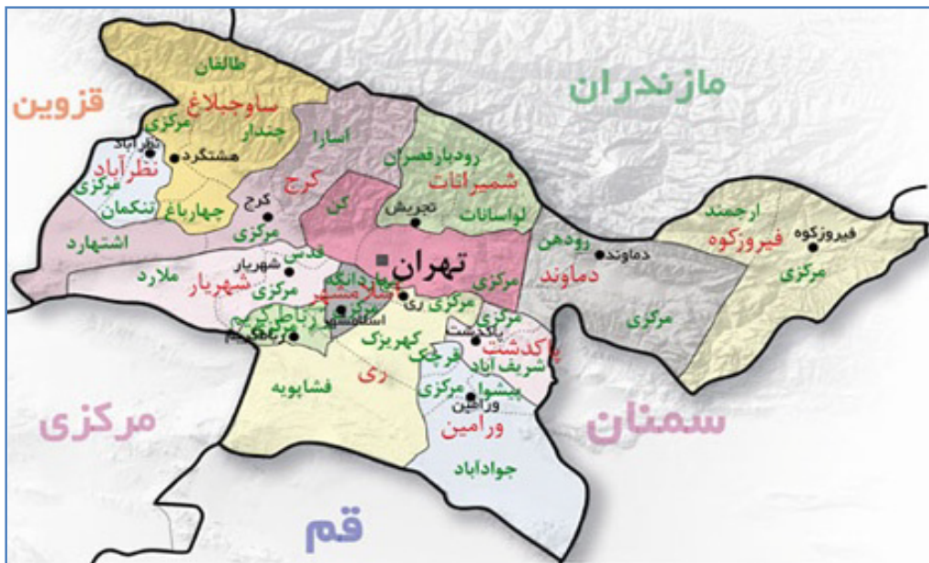
نقشه ۱: مجموعه شهری تهران، ۱۳۸۸.

توسعه مراکز جمعیت در مجموعه شهری تهران نه به صورت متوازن و یکنواخت بلکه بر مجموعه مراکز منطبق است که به نام حوزه‌های شهری شناخته می‌شوند. نواحی ۹ گانه مجموعه شهری تهران عبارتند از: حوزه شهری تهران، کرج-شهریار، اسلامشهر - رباط کریم، ورامین، پاکدشت، هشتگرد، رودهن - پردیس و اشتهارد. هر حوزه مجموعه‌ای از کانون‌های سکونت شهری و روستایی است که یا از یک محور ارتباطی تغذیه می‌کنند یا به یک حوزه کشاورزی وابسته اند (حناچی، ۱۳۸۵: ۵۱-۴۹).