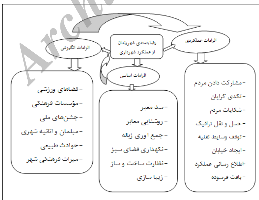
شکل ۳: طبقه‌بندی و الویت‌بندی ویژگی‌های عملکرد خدمات شهری

بنابراین با توجه به ارزیابی عملکرد خدمات شهرداری بر اساس مدل کانو، مدل مفهومی زیر ترسیم می‌گردد.