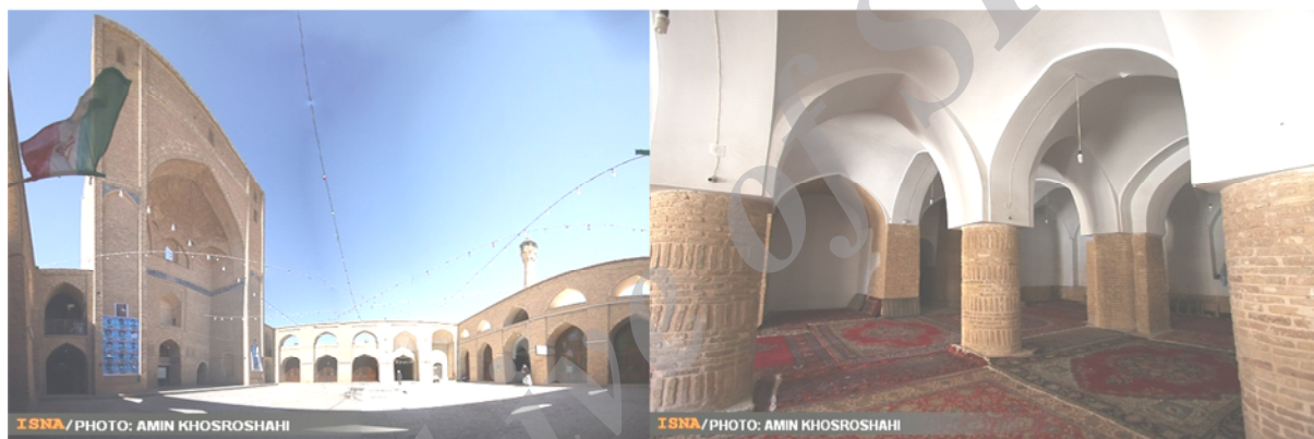
شکل ۲: نمایی از مسجد جامع سمنان

سمنان یکی از کهن‌ترین شهرهای ایران زمین بوده و قدمت آن به پیش از دوره اسلامی می‌رسد. شهر سمنان در عهد ساسانیان نیز وجود داشته و در فتوح مسلمین از آن نام برده شده است. امروزه نیز محله‌های بسیار قدیمی در شهر سمنان وجود دارد که می‌توان از جمله به کهنه دژ اشاره نمود که در داخل محله تاریخی ناسار قرار گرفته است که آثار همان بخش حاکم نشین دوران ساسانیان است. استقرار شهر در مسیر جاده ابریشم که از چین تا مدیترانه امتداد