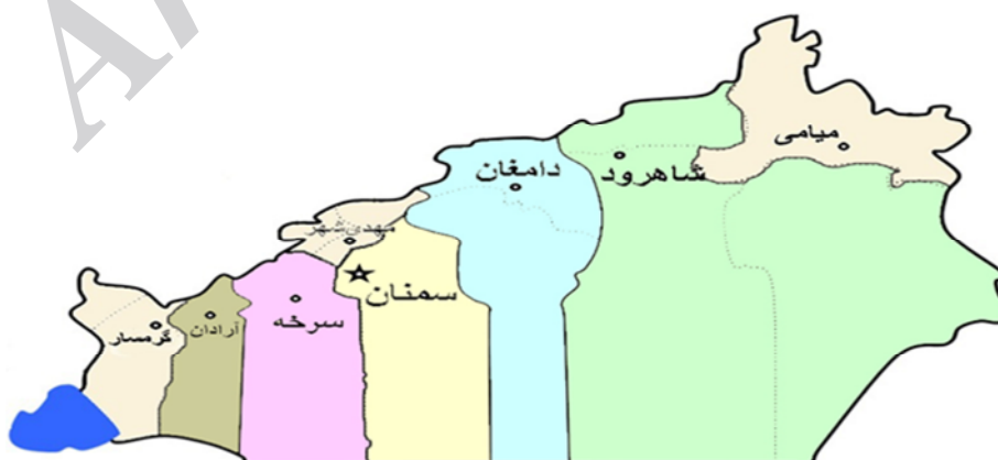
شکل ۱: نقشه استان سمنان