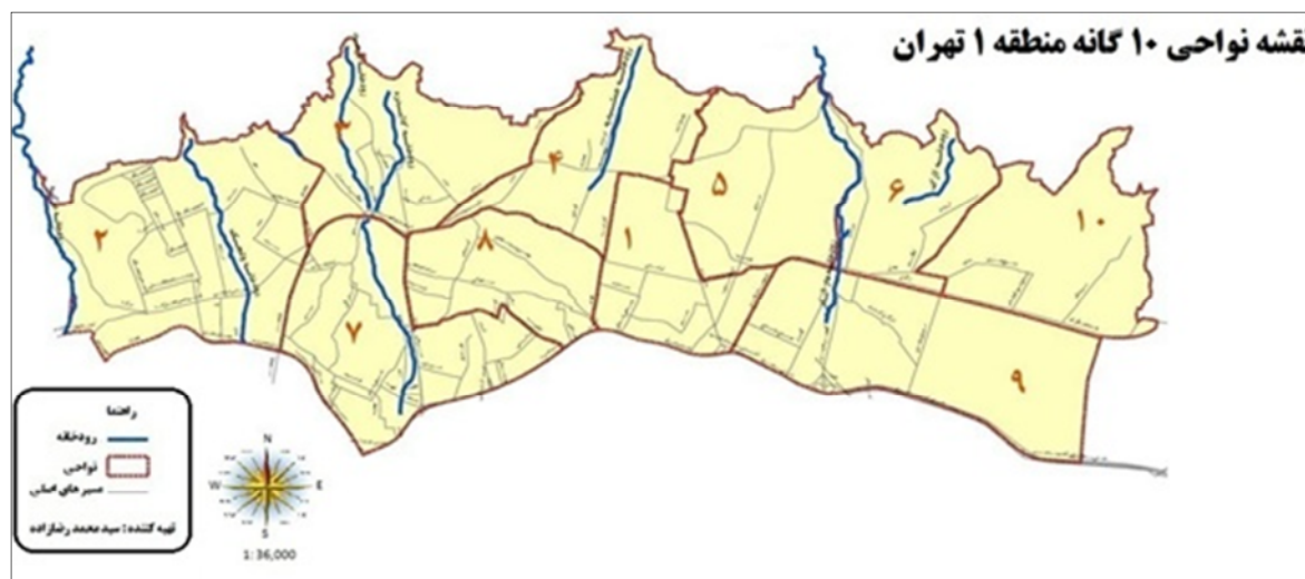
نقشه ۲: نقشه نواحی ۱۰ گانه منطقه ۱ شهر تهران و محلات