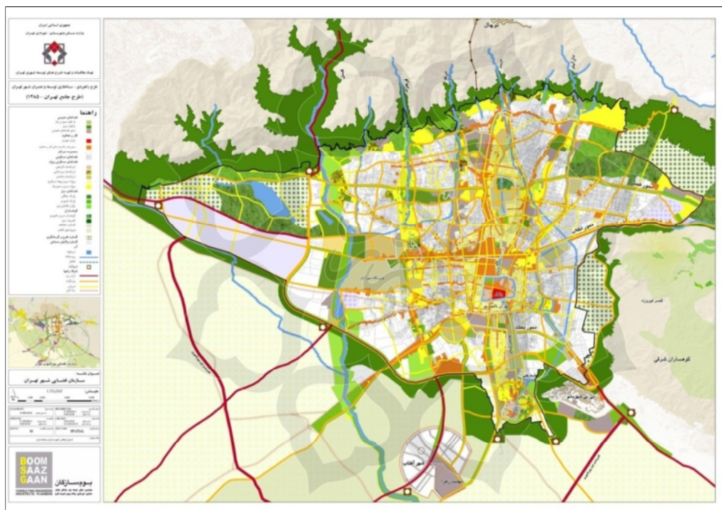
نقشه ۱: نقشه سازمان فضایی تهران و منطقه ۱

تهران در کوهپایه های جنوب کوههای البرز مرکزی و در موقعیت جغرافیایی در ۵۰ درجه و ۳۳ دقیقه الی ۵۱ درجه و ۴ دقیقه طول شرقی و ۳۵ درجه و ۳۵ دقیقه الی ۳۵ درجه و ۵۰ دقیقه عرض شمالی واقع گردیده است. تهران دارای وسعتی برابر با ۷۱۶/۸۹ کیلومتر مربع است که تقریباً ۴ درصد کل وسعت کشور را در بر می گیرد (طرح راهبردی - ساختاری جامع شهر تهران، ۱۳۸۵). ساختار شبکه