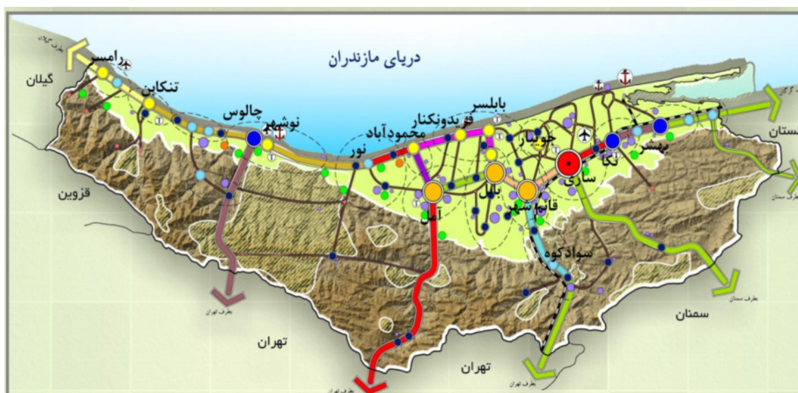
شکل ۳. سازمان فضایی استان مازندران