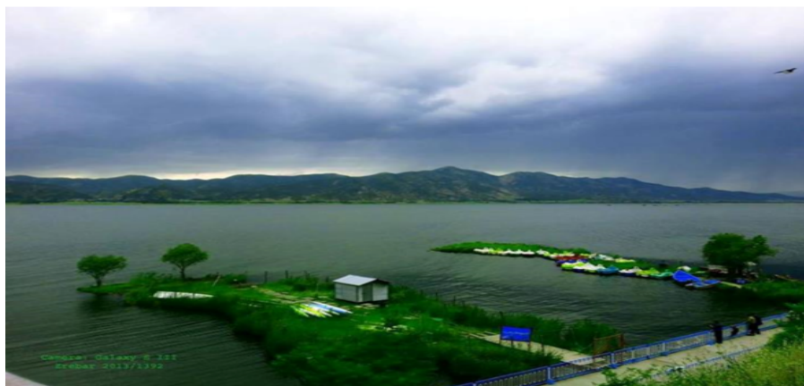
شکل ۲. تصاویری از دریاچه زریبار