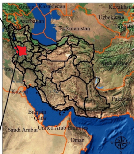
شکل ۱. موقعیت دریاچه زریبار در نقشه استان