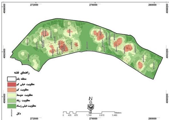
شکل ۴. وضعیت دکل‌های مخابراتی تلفن همراه نسبت به مناطق مسکونی و مراکز حساس جمعیتی

استفاده از توابع عضویت برای هر معیار، اعمال وزن دهی تدریجی و پیوسته بر آن معیار است. در واقع وزن هر پیکسل منوط به مقدار عضویت آن پیکسل در مجموعه است. نقشه حاصل از ترکیب و تلفیق لایه ۶ گانه که بر روی آن‌ها وزن‌های منطقی اعمال شده است.