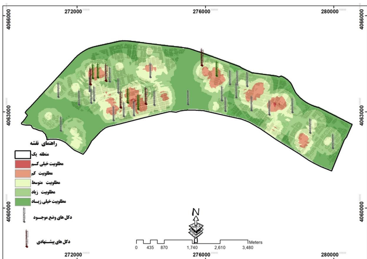
شکل ۵. مکان‌یابی بهینه دکل‌های مخابراتی تلفن همراه نسبت به مناطق مسکونی و مراکز حساس جمعیتی

نقاط پیشنهادی جدیدی در جهت استقرار و جابه‌جایی دکل‌ها به دست آمده است. در واقع دکل‌های نیازمند جابه‌جایی، باید در پهنه‌هایی قرار گیرند که از مطلوبیت‌های متوسط به بالا برخوردار باشد تا تشعشعات اثرگذار دکل‌ها بر سلامت جسمانی شهروندان به حداقل ممکن برسد. همان‌طور که در نقشه پیشنهادی نشان داده شده است، بایستی ۵ دکل با