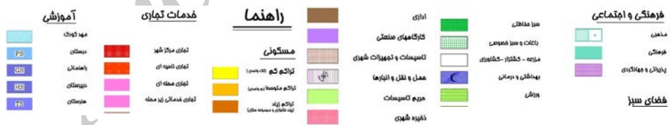
نقشه ۱. کاربری اراضی شهر جدید اندیشه (وضع موجود طرح جامع و پیشنهادات طرح تفصیلی)