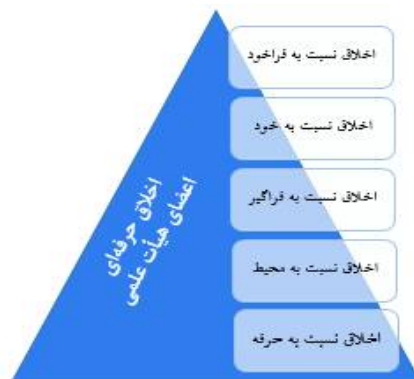
شکل 1: مدل مفهومی پژوهش

در پژوهش حاضر از مدل اخلاق حرفه‌ای مدرسان (قوشی و همکاران، 1396) استفاده شده است. البته محققان با اضافه کردن مؤلفه «نسبت به فراخود»، مدل مذکور را توسعه دادند. مدل مفهومی پژوهش در شکل 1 ترسیم شده است. در مدل اخلاق حرفه‌ای مدرسان، پنج بُعد اخلاق حرفه‌ای نسبت به فراخود، اخلاق حرفه‌ای نسبت به خود، اخلاق حرفه‌ای نسبت به فراگیر، اخلاق حرفه‌ای نسبت به محیط و اخلاق حرفه‌ای نسبت به حرفه آورده شده است.