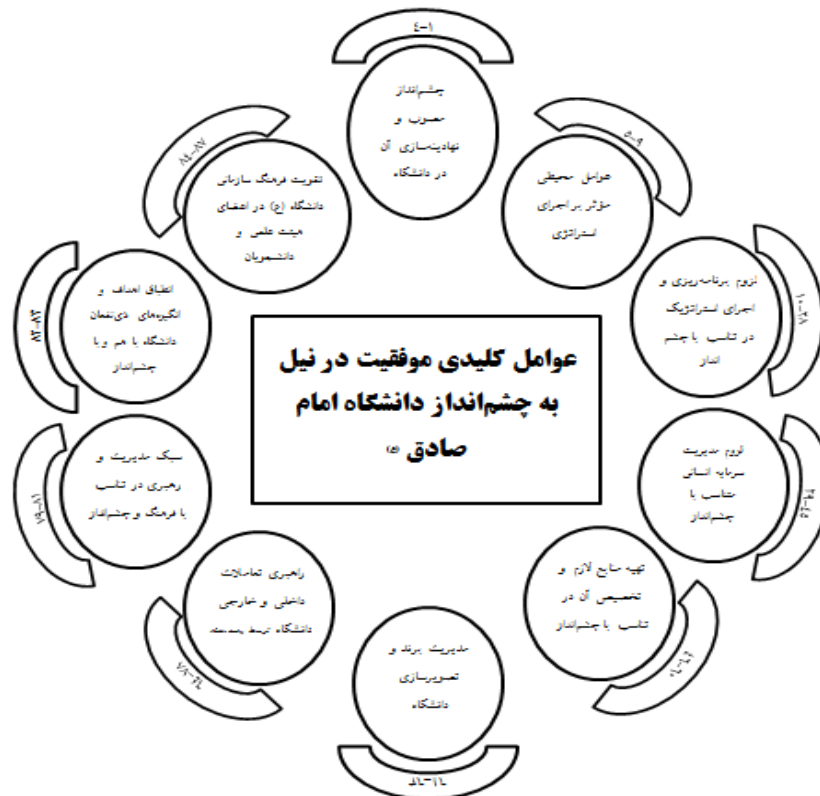
شکل 3: شبکه مضامین پژوهش (عوامل کلیدی موفقیت در نیل به چشم‌انداز دانشگاه امام صادق)

مرحله پایانی اجرای تحلیل مضمون، ترسیم شبکه مضامین است که در آن، مضمونهای برجسته در هر یک از این سه سطح همراه با روابط میان آنها نمایش داده می‌شود. مضمونهای مستخرج از فرایند پژوهش به همراه مضمونهای سازمان‌دهنده مرتبط، در شکل 3 مشاهده می‌شود.