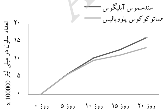
شکل ۳- میانگین روند تغییرات تعداد سلول طی مدت ۲۰ روز از زمان پرورش

مقدار کلروفیل a در جلبک هماتوکوکوس پلوویالیس به‌طور معناداری بیشتر از سندسموس آبلیکوس بود ( P < 0.05 ) ولی مقدار کلروفیل b در جلبک سندسموس آبلیکوس مقدار بیشتری را نسبت به هماتوکوکوس پلوویالیس نشان داد ( P < 0.05 ). براساس نتایج، مقدار کاروتن کل در جلبک هماتوکوکوس پلوویالیس به‌طور معناداری بیشتر از جلبک سندسموس آبلیکوس بود ( P < 0.05 ) (جدول ۴).