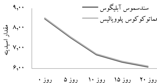
شکل ۱- میانگین روند تغییرات اسیدیته (pH) طی مدت ۲۰ روز از پرورش