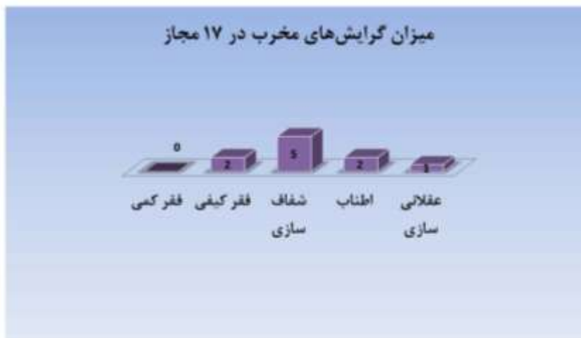
شکل ۲: گرایش‌های ریخت‌شکنانه در مجاز

در ترجمه مثال «سنبل» از غزل ۱۲۰، می‌توان شاهد اطناب بود؛ آنجا که مترجم با هدف روشن‌تر کردن بار معنایی آرایه، توضیحاتی را در گروه می‌آورد: La [senteur des boucles .de] jacinthe