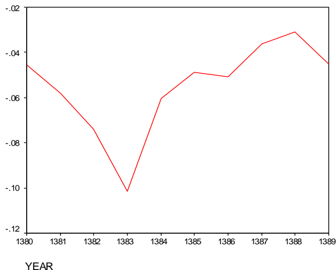
نمایشگر شماره ۲: روند افزایشی محافظه کاری

اطلاعات حسابداری شده است. این موضوع می تواند به دلایل مختلفی مانند کارا نبودن بازار سرمایه ایران و نوسان در اخبار اقتصادی، رفتار فرصت طلبانه مدیریت سود و تاکید بیشتر حسابرسان مبنی بر رعایت استانداردهای حسابداری مربوط باشد. همچنین محافظه کاری غیرشرطی بدون توجه به اخبار خوب و بد و بر اساس استانداردهای حسابداری موجب می گردد تا قابلیت اتکا اطلاعات حسابداری افزایش یابد. در نتیجه مربوط بودن اطلاعات افزایش می یابد که یافته های تحقیق این موضوع را تایید می کند. این موضوع ممکن است بواسطه استفاده از استانداردهای حسابداری ایران باشد که برگرفته از استانداردهای بین المللی است و تقریباً در اکثر کشورهای