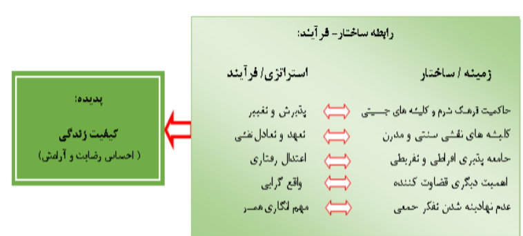
شکل ۱. مدل مفهومی کیفیت

متمرکز ۱ و کسب مقولات عمده انجام شد. این کدگذاری به صورتی است که در هر مرحله، داده‌ها بر حسب شباهت و تفاوت‌هایشان کنار یکدیگر قرار می‌گیرند؛ لذا در هر مرحله به سطح انتزاع داده‌ها اضافه و از حجم و تعداد آنها کاسته می‌شود. در مرحله کدگذاری محوری، پدیده اصلی پژوهش یعنی کیفیت زناشویی با توجه به دو محور اصلی یعنی زمینه (ساختار) و استراتژی (فرایند) مورد تحلیل قرار گرفت. مدل مفهومی پژوهش در شکل ۱ به تصویر کشیده شده است که در ادامه جزئیات آن تشریح می‌گردد.