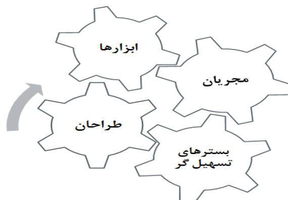
نمودار ۱: ارکان عملیات جنگ نرم و رابطه آن‌ها با یکدیگر در کلام امام علی(ع)

این چهار رکن به نوعی تأثیر بر یکدیگر دارند. زمینه‌ها محرک طراحان در استفاده از ابزارهای مناسب و شناسایی‌کننده ضعف‌های کارگزاران هستند. به علاوه کارگزاران و نقاط ضعف آن‌ها در طراحی محتوا به طراحان جنگ نرم کمک می‌کنند. شکل زیر گویای رابطه این چهار رکن است: