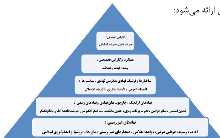
شکل ۳- چارچوب نظری برای طراحی الگوی کارایی اقتصاد مقاومتی جمهوری اسلامی ایران

لذا حضرت امام خامنه‌ای نیز بر پیشرفت و عدالت، در مسیر رشد اقتصادی تأکید دارند و از طرفی، ثبات، رشد و عدالت از اصول اساسی اقتصاد در اصل سیزدهم قانون اساسی است. بنابراین، کارایی تخصیصی باید به سمت رشد، ثبات و عدالت، و کارایی انطباقی نیز به سمت تاب‌آوری اقتصاد حرکت کند. با توجه به موارد فوق، چارچوب نظری تحقیق ارائه می‌شود: