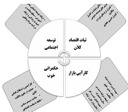
شکل ۲- شرایط لازم برای تاب‌آوری اقتصادی (بریگو گلیو، ۲۰۰۸: ۷)

متغیرهای اصلی تاب‌آوری اقتصادی عبارت‌اند از: اول، متغیرهای اقتصادی که توسط پایداری اقتصادی کلان و کارایی اقتصاد بررسی می‌شوند؛ دوم، متغیرهای اجتماعی - سیاسی که از سوی حکمرانی سیاسی خوب و توسعه اجتماعی مورد بررسی قرار می‌گیرند در شکل ۲ شرایط لازم برای تاب‌آوری اقتصاد و متغیرهای اصلی آن آمده است.