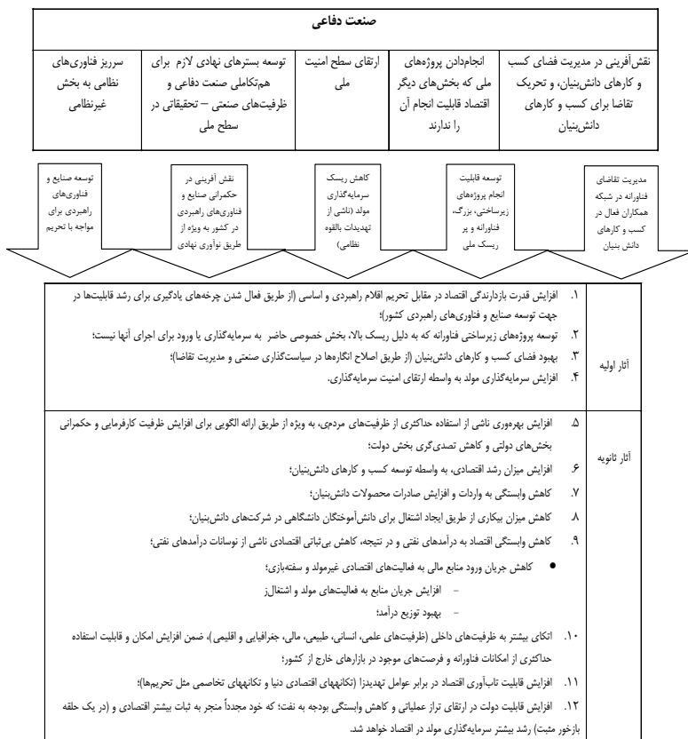
جدول ۳- الگوی تأثیر صنعت دفاعی بر اقتصاد ملی در گذار به اقتصاد مقاومتی

بعد از ارزیابی و اصلاح الگوی اولیه در کارگروه تخصصی گروه کانونی و تأیید اعتبار نتایج توسط اعضا، الگوی نهایی به صورت زیر استخراج شده است: