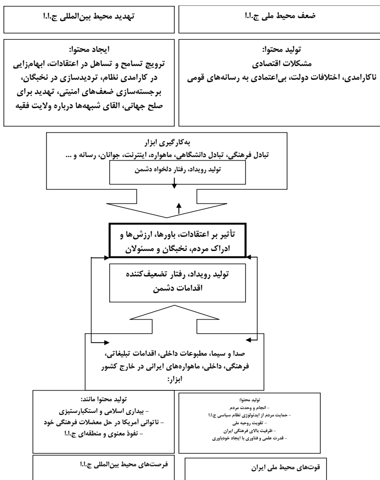
شکل ۱- مدل مفهومی تأثیر و تأثر دیپلماسی عمومی ایران و آمریکا بر سیاست خارجی آمریکا