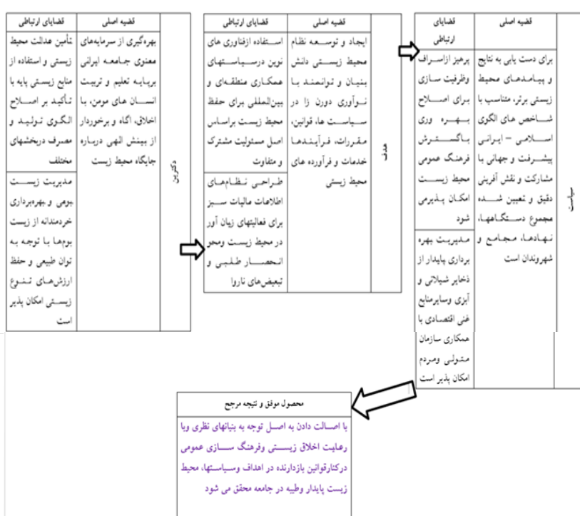
شکل ۳- فرایند رسیدن به نظریه

مرحله پایانی: روندشناسی تکاملی مراحل سه‌گانه مذکور در پیوند قضایای اصلی و ارتباطی و مؤلفه‌های سه‌گانه مدیریتی نشان می‌دهد که «با اصالت دادن به اصل توجه به بنیان‌های نظری و با رعایت اخلاق زیستی و فرهنگ‌سازی عمومی در کنار قوانین بازدارنده در اهداف و سیاست‌ها، محیط زیست پایدار و طیبه در جامعه محقق می‌شود». این عبارت به عنوان محصول موفق و نتیجه مرجح در حوزه محیط زیست است؛ بنابراین می‌توان آن را مبدأ شبه‌نظریه در حوزه محیط زیست دانست.