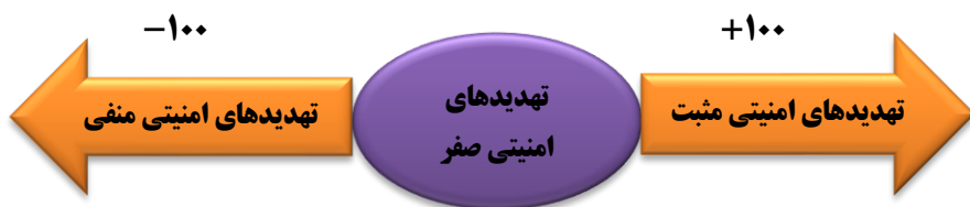
شکل ۱. طیف بندی محیط تهدیدهای امنیتی ج.ا.ایران

بر اساس جدول و شکل شماره ۴ طیف بندی تهدیدهای امنیتی ج.ا.ایران در سه سطح منفی، صفر و مثبت می‌باشد. در سمت چپ طیف تهدیدات منفی و کوچک مثل گروه‌های تروریستی داعش و کشورهای همگونی مثل عربستان سعودی است. در وسط طیف تهدیدات صفر مثل قدرتهای منطقه‌ای همگون است و در سمت راست طیف تهدیدهای مثبت و کشورهای قوی مثل ائتلاف امریکا است. تهدیدهای منفی بیشتر در مرزهای امنیتی ج.ا.ایران قرار دارند، تهدیدات صفر و مثبت بیشتر در جغرافیای امنیتی ج.ا.ایران قرار دارند. متنوع بودن طیف تهدیدها و پیچیدگی آن باعث شده تا حلقه‌های امنیتی با حلقه تهدیداتی ج.ا.ایران برعکس هم باشند.