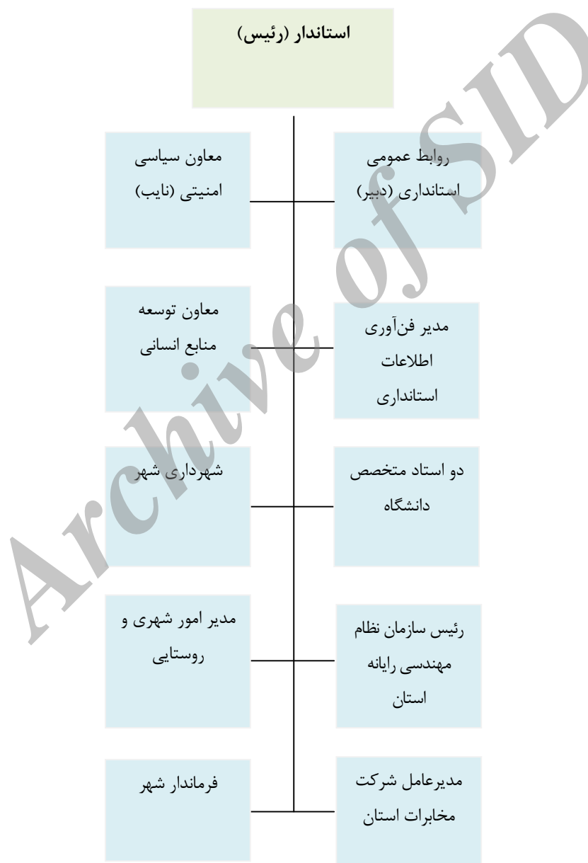
نمودار ۱- ساختار پیشنهادی شورای شهر الکترونیکی برای استان قم