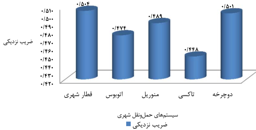
نمودار ۱- اولویت بندی سیستمها