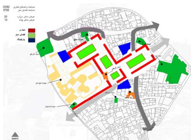
شکل ۲- پلان دیاگرام گزینه دوم طراحی

گزینه دوم طراحی: با قرار دادن حجره‌هایی با رواق، از یک سو حالت سنتی محوطه حفظ شده و از