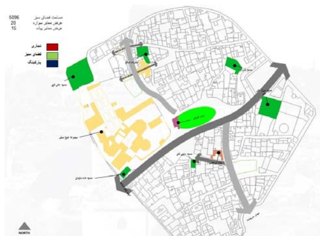
شکل ۳- پلان دیاگرام گزینه سوم طراحی

گزینه سوم طراحی: در این گزینه پیشنهادی از ساماندهی محدوده، با عریض‌تر کردن کوچه‌های باریک،