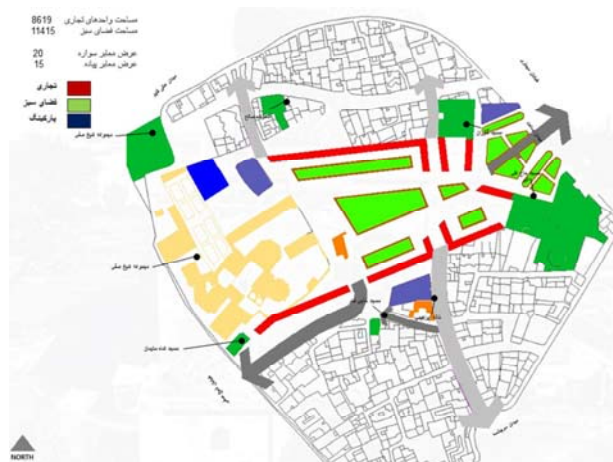
شکل ۱- پلان دیاگرام گزینه اول طراحی

دعوت‌کننده دارد، برای مرکز محله تعریف کرد. برای ورودی می‌توان یک ایوان در نظر گرفت، بعد از ورود از