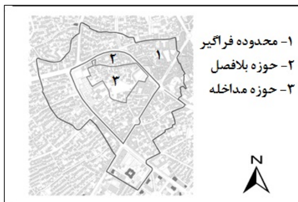
نقشه ۱- موقعیت محله شهیدگاه بقعه شیخ صفی در شهر اردبیل

محدوده تحقیق، در نیمه شمالی شهر اردبیل و در مرکز محدوده ۹۶ هکتاری بافت کهن اردبیل قرار گرفته است (نقشه ۱). محورهای اصلی مورد مطالعه، اطراف محدوده خیابان امام خمینی، بخشی از اولین خیابان شهر اردبیل است که در سال ۱۳۰۷ برای اتصال دروازه ورودی شهر از طرف تبریز به طرف آستارا احداث شده است. خیابان کاشانی نیز بخشی از دومین خیابان ساخته‌شده در شهر اردبیل در سال ۱۳۴۶ است. جدا از این که هر دو محور مورد مطالعه، جزء معابر مهم و اساسی و درجه یک شهر اردبیل (از دید میزان تردد و