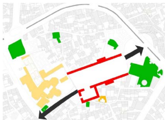
شکل ۵- پلان دیاگرام گزینه پنجم طراحی

گزینه پنجم طراحی: در این آلترناتیو، سعی شده است با ساماندهی و از میان برداشتن