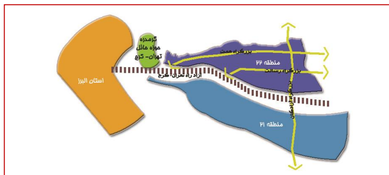
نقشه ۲- موقعیت استراتژیک منطقه ۲۲ شهر تهران از لحاظ جغرافیایی

- طرح مجموعه شهری، عمده فضاهای باز و سبز موجود مجموعه شهری تهران را شامل چهار پارک جنگلی (چیتگر، قرچک، لویزان و سرخه حصار) و نیز کمربند سبز تهران، پارک چندمنظوره پردیسان و باغ گیاه‌شناسی ملی در محور تهران- کرج را برای نیازهای