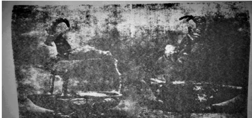
قنديلان من صنّع العربيّة بظّهر فيهما بعض حيوان البلاد تصوير ٣ تصوير صفحة ١١ كتاب