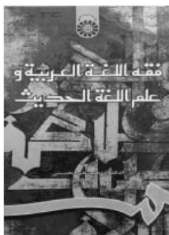
شکل ۱ تصویر جلد کتاب فقه اللغة العربیة و علم اللغة الحدیث