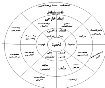
شکل ۱. حوزه‌های تنوع (گادرنسوارتز و راوی، ۱۹۹۴)

دسته دوم تعاریف تنوع اشاره به ابعاد آن دارند. بارون و گرینبرگ ۱ (۲۰۰۰) ابعاد تنوع را در دو طبقه گروه‌بندی کردند: ویژگی‌های غیرقابل کنترل و ویژگی‌های قابل کنترل، طبقه اول، شامل ویژگی‌های بیولوژیکی از پیش تعیین شده است مانند نژاد، سن، جنس و برخی ویژگی‌های فیزیکی و هم‌چنین جامعه، خانواده و تاریخ که ما در آن زندگی می‌کنیم. این عوامل نفوذ قوی بر هویت فردی دارد و به‌طور مستقیم نحوه ارتباط افراد با یکدیگر و گروه‌ها با هم و به‌طور کلی کار را تحت تأثیر قرار می‌دهد. طبقه دوم، ویژگی‌هایی است که مردم می‌توانند اخذ یا رها کنند یا از طریق انتخاب آگاهانه و تلاش‌های عمدی تغییر دهند. شامل وضعیت تأهل، عقاید سیاسی، موقعیت جغرافیایی، سابقه کاری، آموزش و تخصص است (ترون و مولج، ۲۰۰۶).